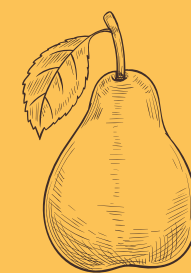
PERA Pyrus communis