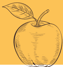
POMA Malus domestica