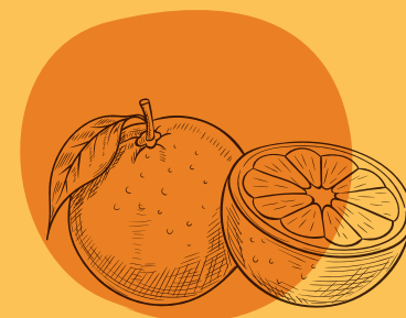
TARONJA Citrus x sinensis