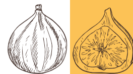
FIGUES Ficus carica